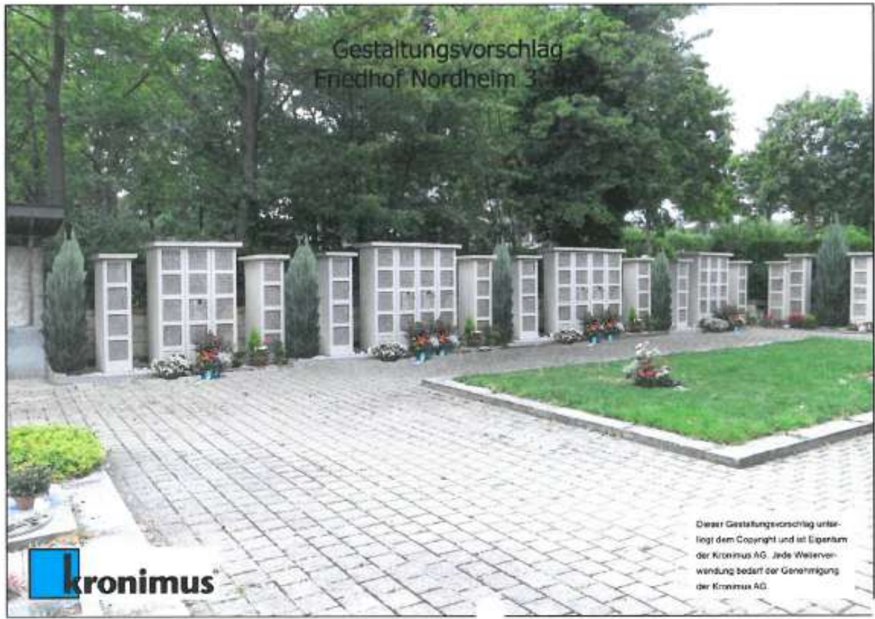
Gestaltungsvorschlag Friedhof Nordheim 3

Dieser Gestaltungsvorschlag unterliegt dem Copyright und ist Eigentum der Kronimus AG. Jede Weiterverwendung bedarf der Genehmigung der Kronimus AG.