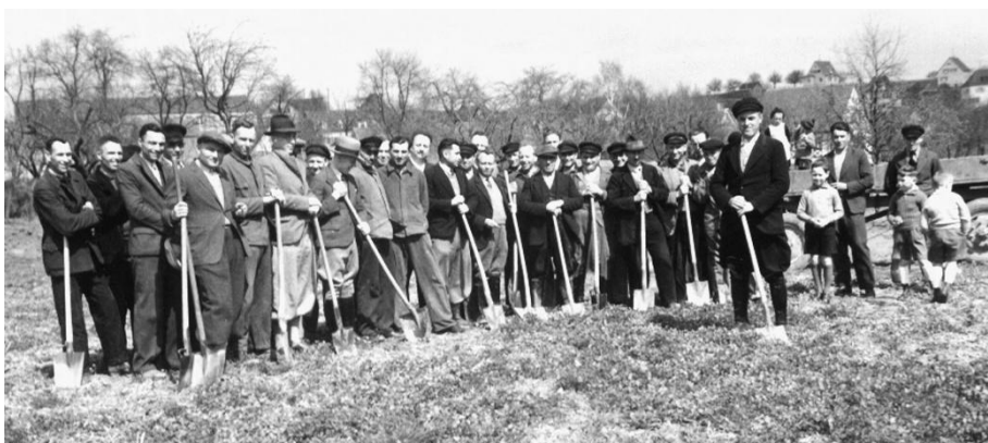
Am 20. April 1939 (Geburtstag des Führers) war der erste Spatenstich

Die Lage wurde Ende März in einer sehr gut besuchten Bürgerversammlung besprochen. Die Teilnehmer waren sich einig, das Freibad unter allen Umständen bauen zu wollen. Jeder war damit einverstanden, dass er 40 Stunden unentgeltlich arbeiten muss, wer dazu nicht in der Lage war musste 24 RM spenden, so auch bei Fuhrleistungen. Die Bereitschaft wurde auf Listen mit Unterschrift festgehalten um diese Verpflichtung den Behörden vorlegen zu können. 450 Männer verpflichteten sich zu dieser freiwilligen Leistung, 4 lehnten aus persönlichen Gründen ab. (Anm.: detaillierter Bericht im Heimatbuch S. 195ff.)