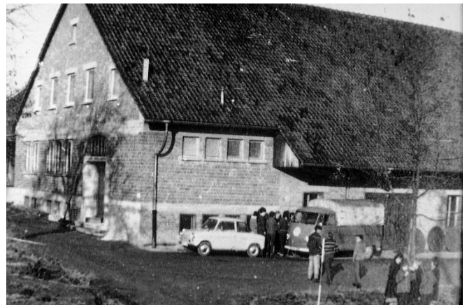
Die Neue Kelter (1950/51)