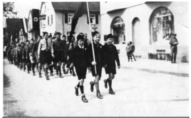
Hitlerjugend in der Bahnhofstraße auf dem Weg zum Hitlerplatz