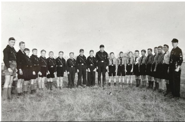
In strammer Haltung und in Uniform präsentiert sich die Hitlerjugend

Durch diese Entwicklung der häufig belegten Sonntage wurde im Frühjahr 1934 eine Neuordnung der bisher jeden Sonntag stattfindenden Christenlehre notwendig. Die Christenlehre fand jetzt nur noch an zwei Sonntagen im Monat statt, nicht mehr wie bisher an jedem Sonntag. Pfarrer Graf schrieb dazu im Gemeindeblatt: „Die Eingliederung der 14-18jährigen Mitglieder der christl. Vereine in die Hitlerjugend und den „Bund Deutscher Mädchen“ hat sich hier im großen und ganzen ruhig vollzogen. Es gilt nun für beide Teile, gegenseitig zueinander Vertrauen zu haben und nötigenfalls beiderseits den Willen zum Verstehen und Zusammenarbeiten an den Tag zu legen. Beide Zweige der Jugendarbeit haben ihre Berechtigung und ihre besonderen Aufgaben. [...]