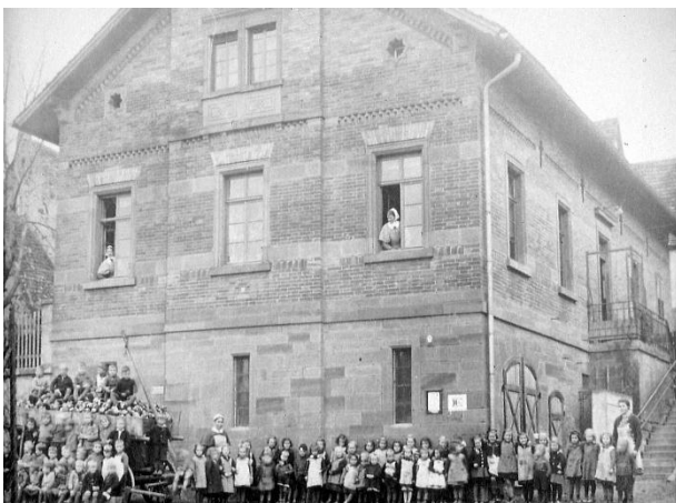
Der 1867 erbaute Seybold'sche Kindergarten

Ein weiterer Konflikt entstand durch den Versuch der Gemeinde, an Stelle des evangelischen Kindergartens einen NSV- Kindergarten einzurichten (NSV = Nationalsozialistische Volkswohlfahrt). So wie die nationalsozialistische Partei die Schule beeinflusste, wollte sie auch die Kindergärten in ihren Einflussbereich ziehen. In erster Linie sollte die NS-Volkswohlfahrt (NSV) sich um die Einrichtung und den Betrieb von Kindergärten kümmern mit eigens dazu ausgebildeten Kindergärtnerinnen. Die Kinder sollten von klein auf ohne Rücksicht auf Konfessionszugehörigkeit in solchen Kindergärten zusammengefasst werden, wo sie im Geiste des Dritten Reiches betreut und erzogen werden. Im Dezember 1941 kündigte Bürgermeister Wagner den Vertrag mit dem Mutterhaus Großheppach über die Anstellung einer Großheppacher Kinderschwester. Von April 1942 an übernahm der NSV den Kindergarten. Mit der Kindergärtnerin Emmy Kühner waren die Eltern aber unzufrieden, und die Zahl der Kinder von vorher etwa 100 ging zurück auf nur noch zwischen 30 und 40 Kinder. Viele Eltern behielten ihre Kinder lieber zu Hause. Nach Kriegsende wurde der Kindergarten im Juli 1945 in alter Form wieder eröffnet. Leiterin war Sophie Urban, unterstützt von der Helferin Luise Kyriss.