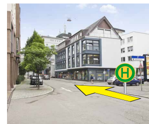
Ebenso in der Gerberstraße: Auch hier befindet sich temporär die Haltestelle Rathaus in der Gegenrichtung.