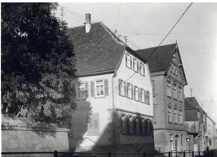
Links das 1804 erbaute Schulhaus östlich neben der Kirche, in dem die Suppenküche eingerichtet war.

Der Bericht über das Armenwesen 1852 zählt auf, dass 17 Personen regelmäßige Geldunterstützung aus der Gemeindekasse erhielten – mehr als doppelt so viele wie in früheren Jahren. 65 Männer und 10 Frauen wurde in diesem Jahr die Möglichkeit gegeben, durch Arbeiten für die Gemeinde ein wenig Geld zu verdienen. Der Bericht informiert auch über die Art dieser Arbeiten: „Steinklopfen, Einwerfung derselben auf die Straßen, Reinigung der Strassen Candel u. des Pflasters innerhalb Etters, Herstellung der Feldwege, Fertigung von Wasserabzugsgräben, u. Reinigung der Bronnentrög, auch eisen [= von Eis befreien] der öffentl. Bronnen im Winter, Holztragen p.“