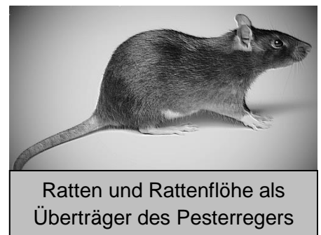
Ratten und Rattenflöhe als Überträger des Pesterregers