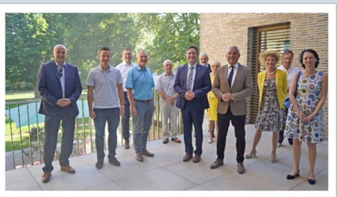
Im kleinen Kreis und nur mit geladenen Gästen konnte im Sommer die Rathauseinweihung gefeiert werden.