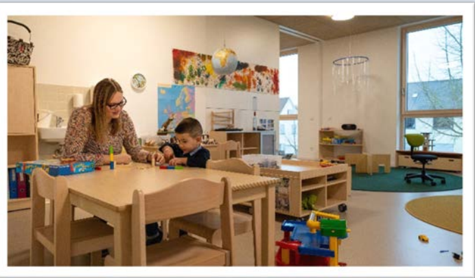
2.200 m 2 Fläche bieten im neuen Kinderhaus Pustelblume viel Platz zum Spielen, Entdecken und Toben.