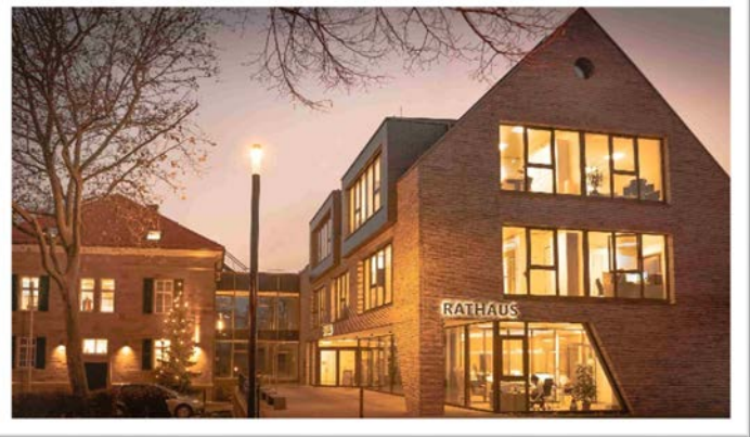
Ein baulicher Höhepunkt in 2020 war die Fertigstellung des Nordheimer Rathauses und der Umzug in die neuen Räumlichkeiten.