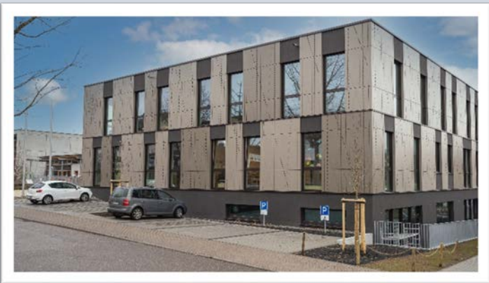
Nach knapp zwei Jahren Bauzeit konnte im August 2020 der Umzug in das neue Kinderhaus Pustelblume in der Südstraße erfolgen.