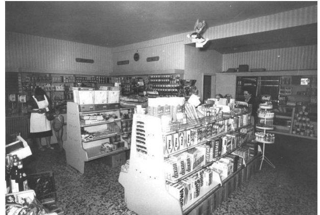
Der VIVO-Laden in der Hauptstraße war der erste Selbstbedienungsladen in Nordheim

Der erste moderne Selbstbedienungsladen war der VIVO- Laden von Gertrud Sinn neben der „Krone“. Wollte man alle Nordheimer Läden bis in die 60er Jahre aufzählen (die allerdings nicht alle gleichzeitig bestanden), käme man auf eine stattliche Anzahl.