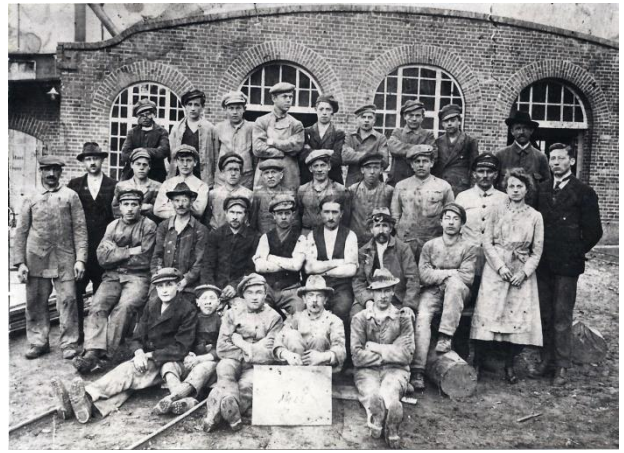
Fabrikarbeiter in Nordheim: links in der Strumpffabrik, rechts im Sägewerk

Mit diesen Veränderungen in der Arbeitswelt gingen aber auch Veränderungen in vielen anderen Lebensbereichen einher. Man benötigte mehr und andere Wohnungen für Arbeiter, die Koch- und Essgepflogenheiten veränderten sich durch die teilweise lange Abwesenheit der auswärts arbeitenden Männer und Frauen. Man hatte auch weniger Zeit für das Kochen, und durch die erforderliche Mobilität veränderte sich das Kleidungsverhalten der Menschen. Dadurch sind neue Bedürfnisse entstanden nach Waren und Gütern des Alltags, die man möglichst direkt am Wohnort kaufen wollte. Das war die Grundlage für die nun neu entstandenen örtlichen Ladengeschäfte. Interessant ist, dass die beiden ältesten Läden in Nordheim jeweils von einem Schulmeistersohn gegründet wurden.