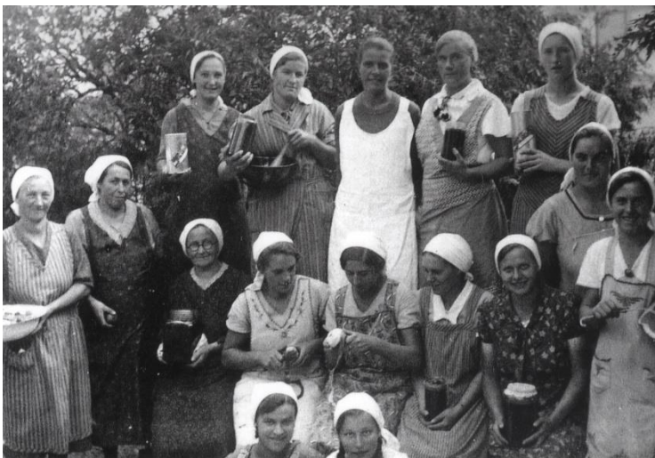
Nordheimer Landfrauen bei einem Einmachkurs (Jahr unbekannt)

Alle Einwohner des Dorfes waren weitgehend Selbstversorger. Der „Krautgarten“ beim