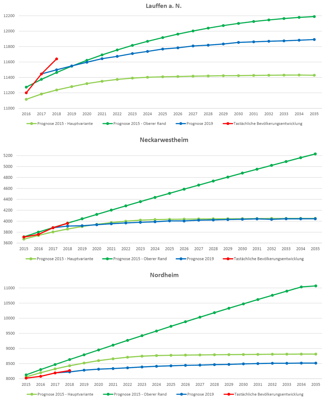
Abb. 1: Bevölkerungsprognosen im Vergleich

Im Vorentwurf zur 2. Fortschreibung des Flächennutzungsplans wurde für die Stadt Lauffen und die Gemeinde Neckarwestheim der „Obere Rand“ des Entwicklungskorridors angenommen, da die tatsächliche Einwohnerentwicklung diesem entspricht.