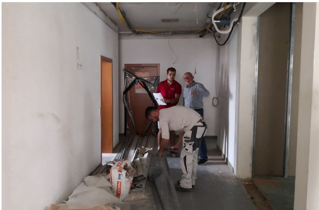
Während der Trockenbau-Handwerker schon die Wände verspachtelt, besprechen im Hintergrund Elektriker und Fachingenieur die Elektroinstallationsarbeiten.