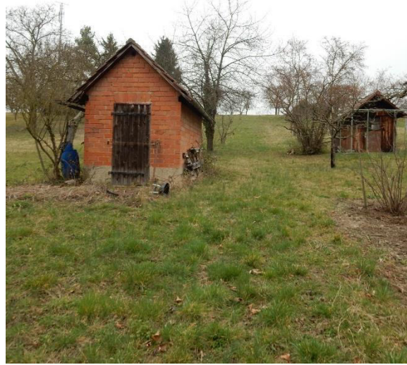
Abb. 3: Mehrere kleine Gartenhütten und Geräteschuppen befinden sich auf und in direkter Umgebung vom Plangebiet.