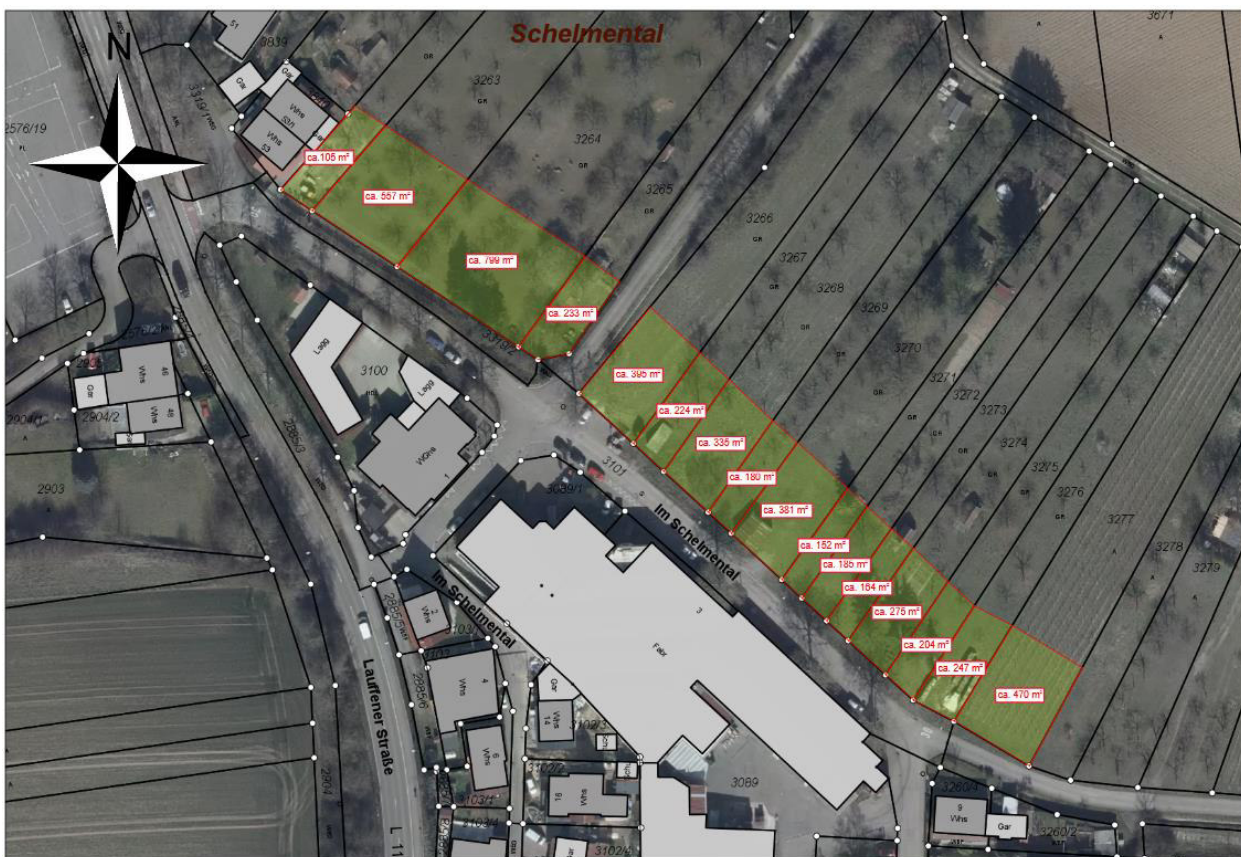
Abb. 1: Lageplan des Baugebiets im „Schelmental“ (Quelle: GEMEINDE NORDHEIM).

Gegenstand der Betrachtung ist die geplante Erschließung des Baugebiets „Schelmental“ im Süden der Gemeinde Nordheim. Das Gebiet soll mit einer einreihigen Wohnbebauung überplant werden. Im Rahmen eines davon unabhängigen Projektes soll das gegenüberliegende Industriegebäude zurückgebaut und mit sieben Mehrfamilienhäusern und zwei Doppelhaushälften überbaut werden. Die endgültige Bebauung und Abgrenzung des Bebauungsplans sind noch nicht abschließend festgelegt.