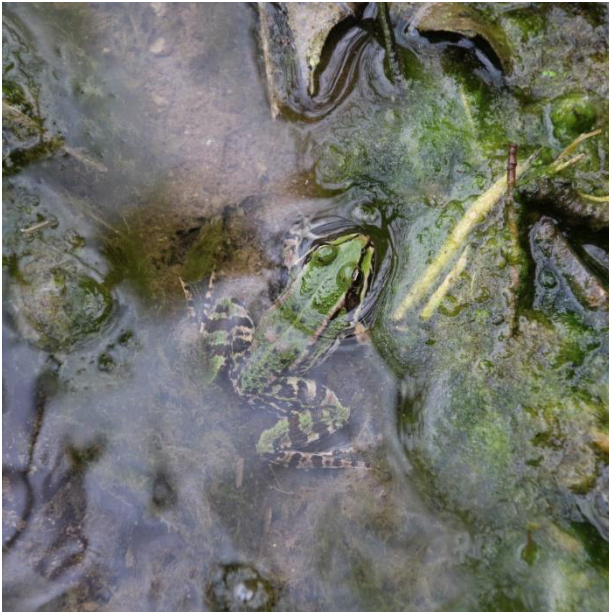
Abb. 3: Ein subadulter Teichfrosch ( Pelophylax kl. Esculentus ) im kleinen Wasserlauf angrenzend zum Projektgebiet.

Um die mögliche Betroffenheit gemeinschaftsrechtlich oder streng geschützter Amphibienarten abschließend zu klären, sind drei Begehungen nötig. Diese erfolgen bei geeigneter Witterung, zu unterschiedlichen Tageszeiten und mit einer Kombination von nächtlichen Verhören, Ableuchten der Gewässer und Erfassen von Larven für Reproduktionsnachweise (vgl. ALBRECHT ET AL. 2014).