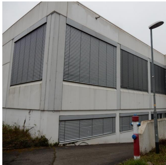
Abb. 2: Die Attika-Verkleidung und Jalousien am alten Fabrikgebäude direkt angrenzend zum Plangebiet bieten Quartierpotentiale für gebäudebewohnende Fledermäuse.