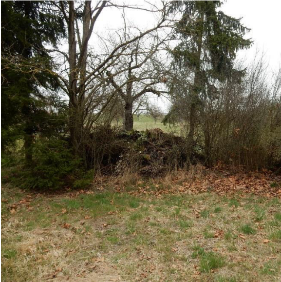
Abb. 2: Kleine Fichtenbaumgruppe mit Holzstapel und Reisighaufen im Plangebiet.