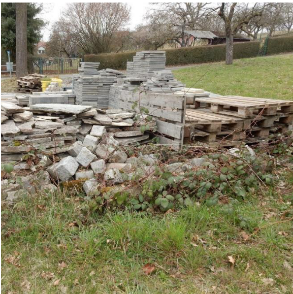
Abb. 1: Ein Stein- und Plattenlagerplatz bietet Unterschlupfmöglichkeiten für Eidechsen.