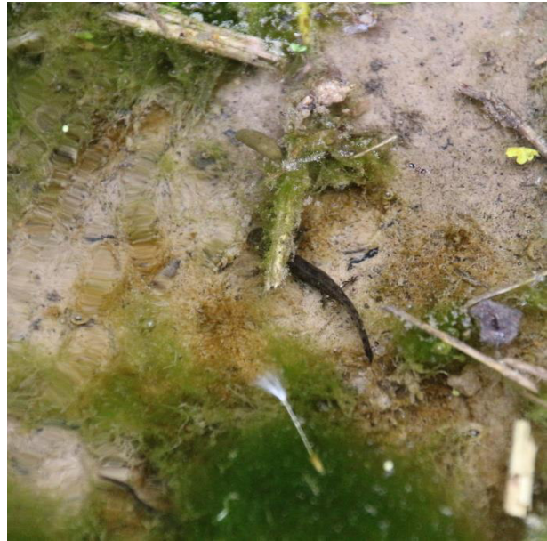
Abb. 4: Larve eines Feuersalamanders ( Salamandra salamandra ) im kleinen Wasserlauf angrenzend zum Projektgebiet.